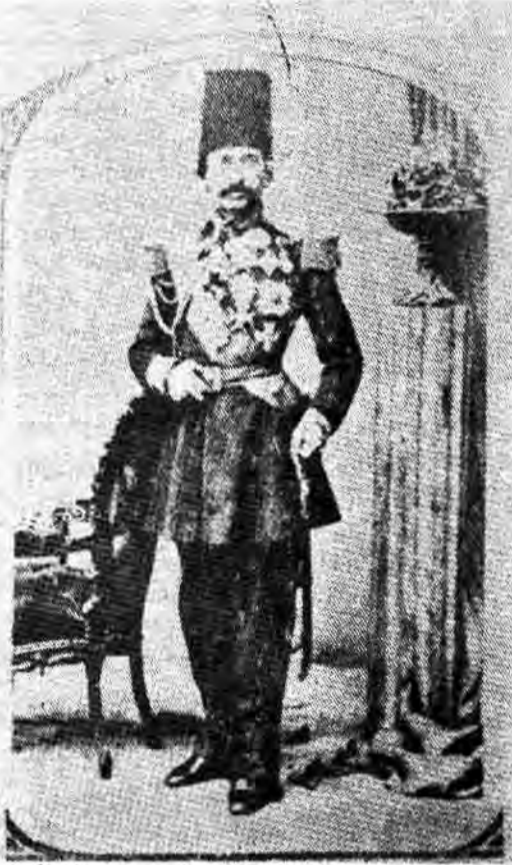
میرزا ملکم خان - از فرنگ رفته‌های معروف ایران و پدر روشنفکری مشروطه

و تا ۲۵ سال در تمامی عواید گمرکات ایران بهره‌گردد این قرارداد آنچنان عجیب بود که لرد کرزن می‌گوید: «بسیهت و بیسهت خارق‌العاده‌ای به مردم اروپا دست داد. هیچ کس فکر نمی‌کرد که یک چنین امتیازی با این شرایط در یک کشور به یک بیگانه داده شود». این قرارداد بر اساس اعتراضات و مخالفت‌های بسیار مجاهدان مسلمان ناصرالدین شاه لغو شد. میرزا ملکم خان: پسر میرزا یعقوب مرتجم سفارت روس که مسیحی ارمنی بود و ظاهرا اسلام آورده بود از فرنگ‌رفته‌های معروف ایران و پدر روشنفکری مشروطه است. پدرش او را در سن ده سالگی به اروپا فرستاد و در یکی از مدارس متعلق به ارمنیه پاریس مشغول به تحصیل شد. وی در سفری که فرخ‌خان کاشی جهت حل اختلاف ایران و انگلیس به اروپا کرد همراه ابراهیم رفیعی رفت و در آنجا وارد تشکیلات فراماسونری شد. را «بلت» سیاستدار انگلیسی از زبان خود ملکم‌خان چنین می‌نویسد: «من خود ارمنی‌زاده‌ای مسیحی هستم ولی در میان مسلمانان پرورش یافته‌ام و در وجهه نظرم اسلامی است. در اروپا که بودم سیستمهای اجتماعی و سیاسی و مذهبی مغرب را مطالعه کردم و با اصول مذاهب گوناگون دنیای نصرانی و همچنین تشکیلات فراماسونری آشنا گردیدم و طریقی ریخته که عقلم سیاست مغرب را با خود دیانت مشرق بهم آمیزم چنین