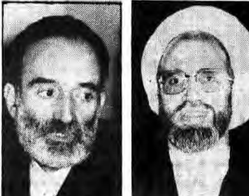
پزشکان خارجی که هیچ گونه آشنایی به فرهنگ و زبان ما ندارند نمی‌توانند زیاد مشغول واقع شوند، در حالی که پزشکان ایرانی که از فرهنگ و دیگر مسائل مردم ما اطلاع دارند بهتر می‌توانند خدمت کنند.

بهداری در زمینه جذب پزشکان ایرانی خارج از کشور می‌کوشد: ما حدود ۱۶ هزار پزشک در آمریکا و بیش از ۵ هزار پزشک در اروپا داریم و