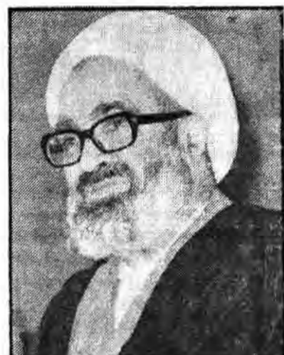
رژیم سعودی با اعمال وحشیانه خود نسبت به حجاج ایرانی می‌خواست برای ملت مسلمان و مظلوم عربستان قدرت نمایی کند

به گزارش خبرگزاری جمهوری اسلامی در این دیدار استاذ حج‌تلا سلام موسوی خوینیها گزارش کاملی از کارهای انجام گرفته در مراسم سال حج گذشته و مطالب رژیم سعودی در سر خوردن یا حجاج ایرانی را به استحضار ایشان رساند.