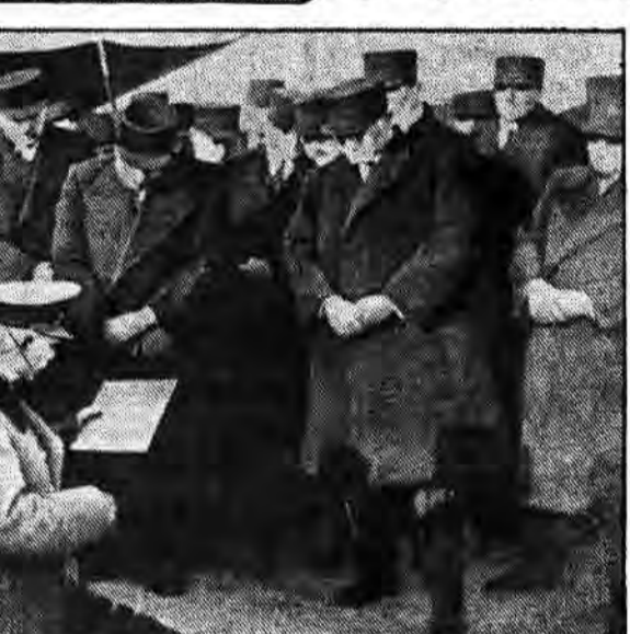
رضا خان پهلوی همراه عده‌ای از نوکرانش هنگام دفن بنای دانشگاه تهران - در این مراسم تدفین چیمبیز را زیر خاک پنهان کردند؟

عالیتر نه دولت عازم این سفر شد. در فروردین ۱۳۱۰ وی از طرف رضاخان مأمور تهیه طرح تاسیس دانشگاه تهران گردید و در خرداد ماه آن سال طرح مذکور را از نیویورک به وزارت دربار فرستاد و در پهن ماه ۱۳۱۰ به تهران بازگشت. بعد از بازگشت، وی مأمور اجرای طرح تاسیس دانشگاه تهران شد و ریاست دارالمعلمین عالی