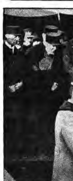
رضا خان پهلوی همراه عده‌ای از نوکرانش هنگام دفن بنای دانشگاه تهران - در این مراسم تدفین چیمبیز را زیر خاک پنهان کردند؟

از جمله مفروضات طرح تاسیس دانشگاه که توسط دکتر عیسی صدیق تهیه گردیده آمده است: «دانشگاه تهران در درجه اول به تعلیم و تربیت پیشوایان و رؤسای قوم بهر دوازده درجه دوم به تحقیق و تتبع و ایجاد علم»