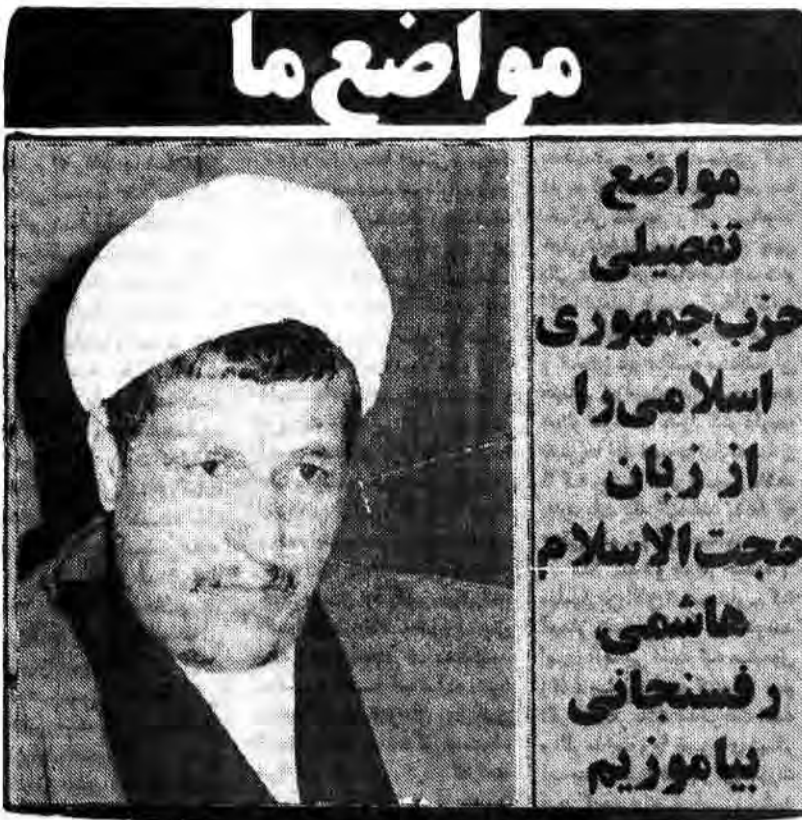
مواضع ما تفصیلی حزب جمهوری اسلامی را از زبان حجت الاسلام هاشمی رفسنجانی پیاموریم