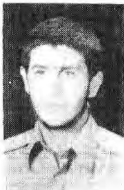
مکتبی که شهادت دارد اسارت ندارد

به نام حادای شهیدان و شاهدان همیشه تاریخ و به نام حادای قهار و دین کوبیده ستمگران و سه نام حادای مومنین و موفقین