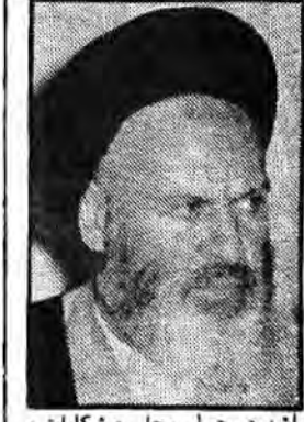
رئیس دیوان عالی کشور

درباره تصمیم گیریهای اخیر ستاد مرکزی پیگیری اجرای پیام هشت ماده ای امام امت آقای موسوی اردبیلی رئیس دیوان عالی کشور در گفتگویی با تهرانیها و همکاران در مورد انعکاس پیام امام در جامعه و تقاضای مردم برای اجرای سریع مصاد این پیام تصمیم گیریهای اخیر رئیس ستاد و تفویض حق عزل مقامات به ستاد از سوی امام و همچنین سواستفاده های که از پیام امام صورت گرفته است مطالبی بیان کرد.