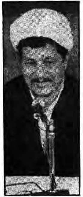
رئیس دیوان عالی کشور

قد قربت به خداوند در خدمت به مردم پیاده کردن یکی از اصول اسلام تلاش میکنید. رئیس مجلس شورای اسلامی ضمن ارائه رهنمودهایی در جهت رفع نیازمندیهای نهضت سوادآموزی گفت چون ما میخواهیم مردم با سواد شوند پس لازم است که نهضت سوادآموزی نفرات وامکانات مورد نیاز خود را در استعلامی تنظیم نماید که تا با گنجینه سخنانش خطاب به اعضای دفتر مرکزی نهضت سوادآموزی گفت: جمهوری اسلامی افرادی مثل شما را که در روستاها و مناطق محروم خدمت کرده اند، برای آن بوده که بهترین عمل را در تلاش خود ادامه دهند.