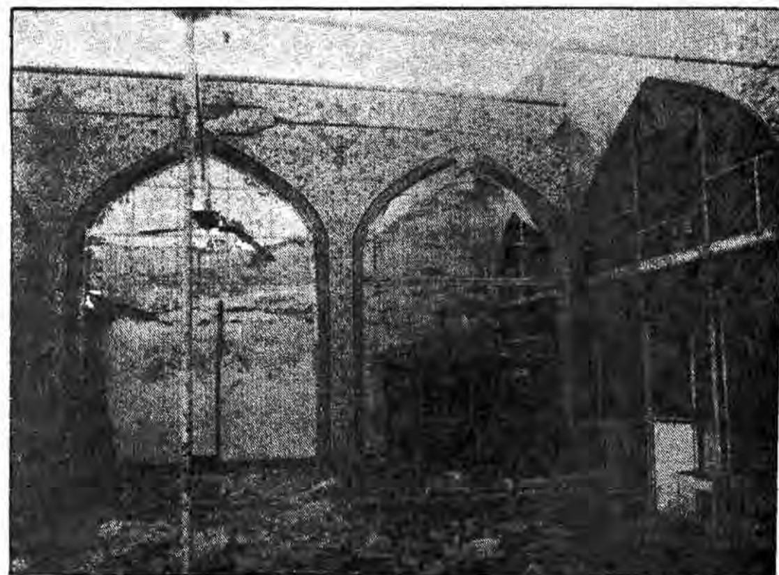
این بدان معنی است که صلح شرافتمندانه هدف نهایی مردم ایران است.

ادامه دارد ... است. این بدان معنی است که صلح شرافتمندانه هدف نهایی مردم ایران است.