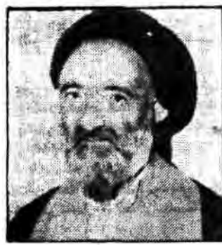
زنجان - خبرنگار جمهوری اسلامی: طی یک گفتگوی...

امام جمعه زنجان با اشاره به فرمان امام‌ای امام و پیگیری این... فرمان گفت: ساد پیگری هم با کمال حدیث فرمان امام را... در مملکت پیاده میکنند و اینها هستند همون دستمندان که... اسلام و در این راه با مشکلات و ولزاتی‌هایی که معمولاً برای... اینگونه حرکتها وجود داشت دست و پنجه نرم نمود و پیروز از این... امتحان بیرون آمد و خطی که از بند شروع دنبال میکرد آن... خط اصلی اسلام و خط امام بروز بود.