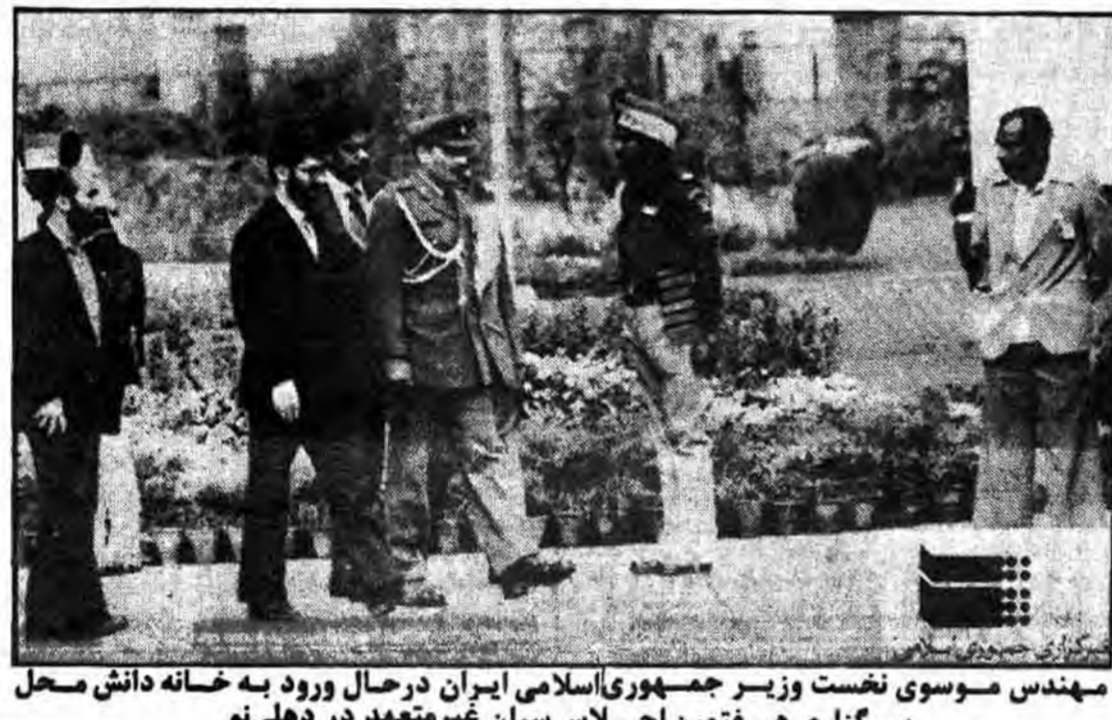
مهندس موسوی نخست وزیر جمهوری اسلامی ایران در حال ورود به خانه دانش محل برگزاری هفتمین اجلاس سران غیر متعهد در دهلی نو

با تصمیم ستاد بسیج اقتصادی کشور: سهمیه لوازم خانگی تعاونیهای کارگران و کارمندان افزایش یافت ● کارخانجات بستدریج قیسمتهای محصولات خود را کاهش خواهند داد در همین صفحه اسامی پذیرفته شدگان مرحله اول پذیرش کشتیرانی جمهوری اسلامی ایران اعلام شد در صفحه ۲