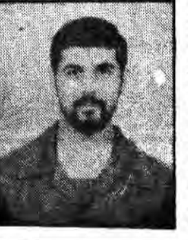
نوردهم اردیبهشت ماه سال ۱۳۳۷ در یک خانواده ساده در شهرستان بندرانزلی چشم به جهان گشود...