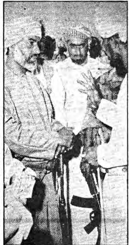
سلطان قابوس، شاه عمان، یکی از نمادهای «جاهلیت جدید» است

در قرآن، این صفات با حالات وسخندگی، استعجاب و جدي از اطاعت، مایلین به قدرتهای خود، اعتماد به نفس بی حد و حصر، احساس استقلال مطلق و امتناع قوی و ترنارل ناپذیر از خضوع در برابر هر مرجع، خواه خدا باشد یا بشر، مغایرت دارد. این صفات، ویژگی‌های معروف اعراب عصر جاهلیت بود و اعراب عصر «جاهلیت» اینها را عالیترین «محاسن» میدانستند که مردی که از ارزش «مرد» خوانده شدن را داشته باشد، داراست. این محاسن، به عنوان مظاهر احساس افتخار تلقی میشد. اصطلاح «جهلیت» در قرآن به عنوان یک ویژگی