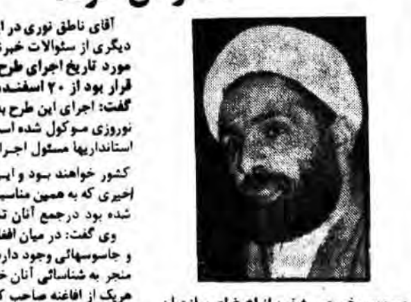
وزیر کشور در یک گفتگوی اختصاصی: سازمان ملل به مابخاطر پذیرائی گرمی که از افغانه بعمل می‌آوریم اعتراض کرد!