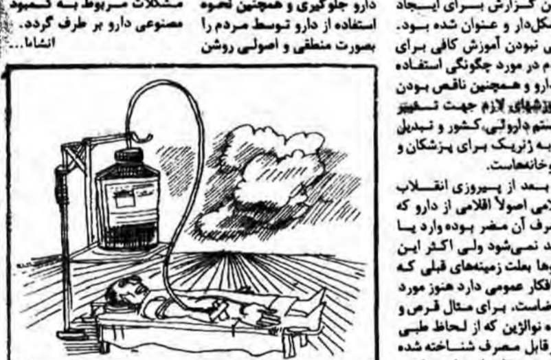
دارو جلودگی و همچنین نحوه استفاده از دارو توسط مردم را بصورت منطقی و اصولی روشن نماید.

در نظر گرفتن جمعیت و احتیاجات دارویی هر منطقه یکی از علتهای ناهماهنگی توزیع دارو است. برای مثال در جنوب تهران به علت زیاد بودن تعداد کودکان، اکثر داروهای است که استفاده می‌شود مربوط به کودکان است. و البته بعضی از داروها نیز در منطقه شمال تهران مورد احتیاج بیشتری است مثل داروهای قند، چربی خون و غیره.