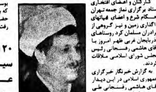
رئیس مجلس: بدون شک در جامعه اسلامی ما روزی خواهد رسید که تمام صاحبان حق به حقوقشان میرسند