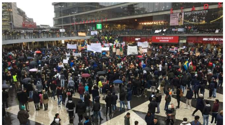
Tusentals i protest mot utvisningar av afghanska barn-Stockholm

En av våra elever skrev så här: ”Tack Sverige som gav mig en penna för att rita min framtid istället för en pistol att skjuta människor med”. I skydd från vuxenkrig och soldatliv har vi lärare haft möjlighet att reparera våra elevers känsla av värde, genom att följa skollagen och den barnkonvention vi är i färd med att implementera i lag här i Sverige. Det har väckts ett hopp. Med hoppet som drivkraft lyckas vi i vår undervisning. Utan hopp går det inte att lära sig ett nytt språk, nå betyg och förbereda sig för vuxenlivet i vårt komplexa informationssamhälle, såsom de svenska barnen förväntas göra.