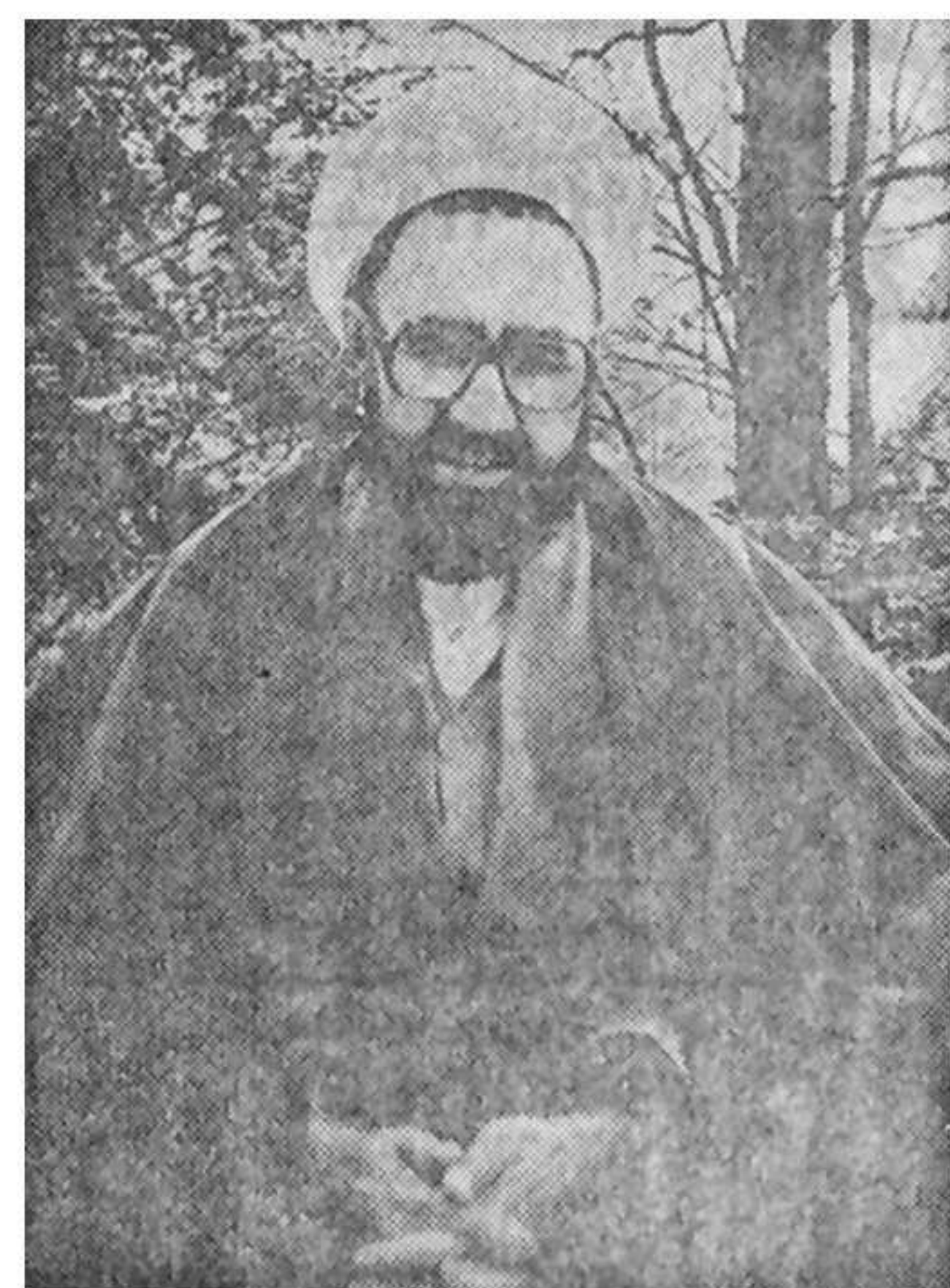
محل این تصویر، نگاره‌ای از استاد شهید مطهری است. در این تصویر، او با عینک و کلاه مشکی، در حال مطالعه یا تدریس است.

معمولا دعوت به این صورت است که کس دیگری را بسمت آنچه که خود دارد، میخواند.