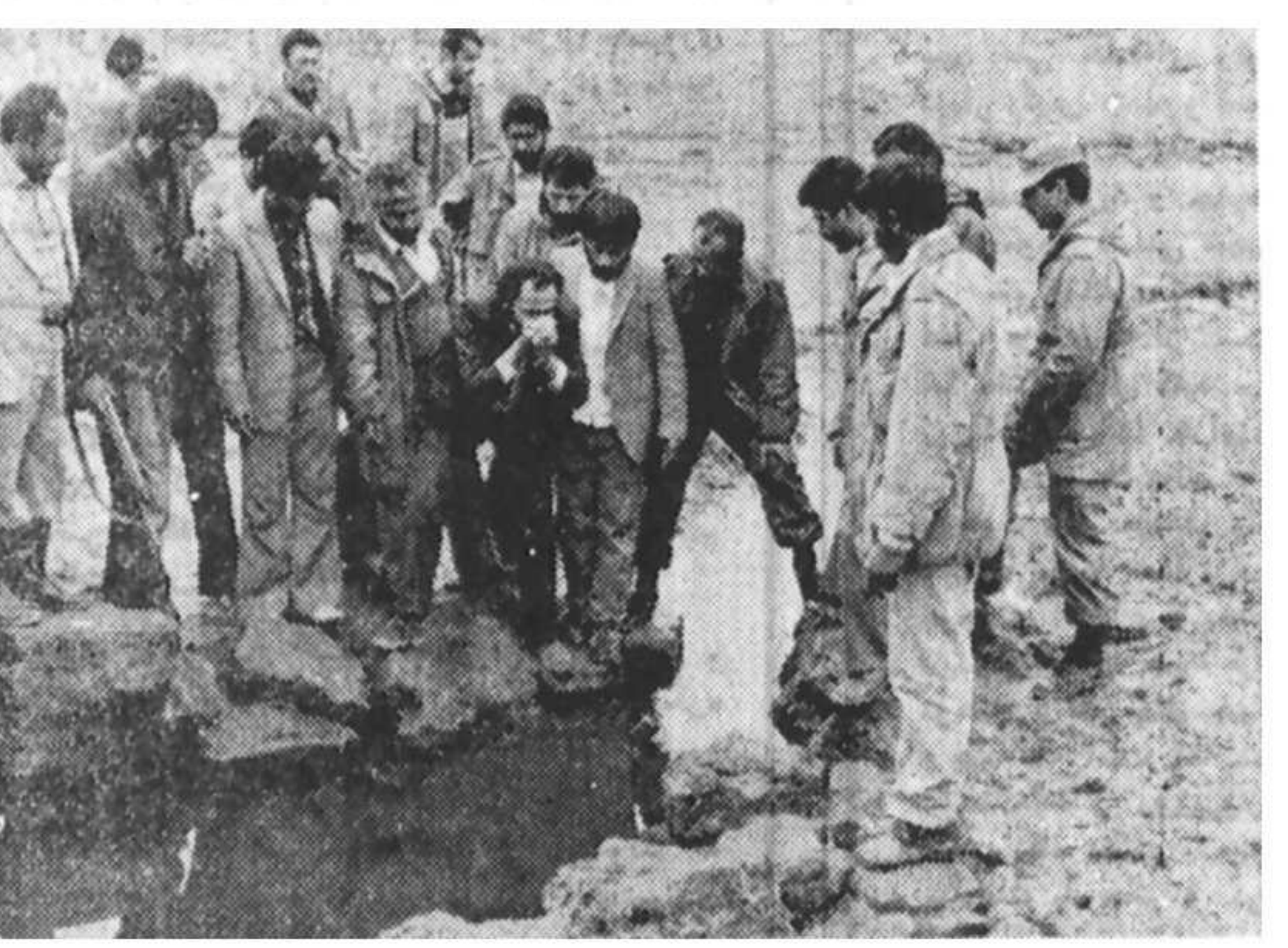
چشمه روستای مخزرمات که به علت آلودگی آب آن به گوگرد ، ترش‌زه است . استاندار آذربایجان غربی از این آب مینوشد و به دیگران نیز تاز می‌کند تا بدانند چقدر و محرومی بر ساکنان مستضعف این روستا حکم است .

استاندار آذربایجان غربی در حالی که در میان این مردم زحمتکش و سختکش و محروم ، به شدت متأثر شده است ، به سرعت به محسوسه فئات مبرد ، تسهیلاتی را بر آب می‌کشد و مینوشد و بلافاصله به همراهان می‌رود .