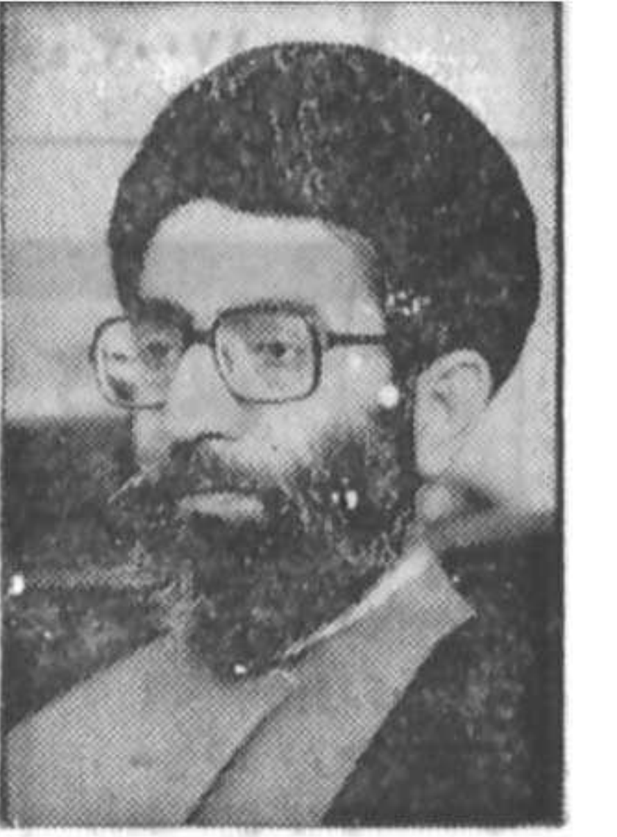
چهره محبوب و عزیز و دوست داشتنی و فراموش نشدنی شهیدان از هر سنده افتخاری بالاتر است