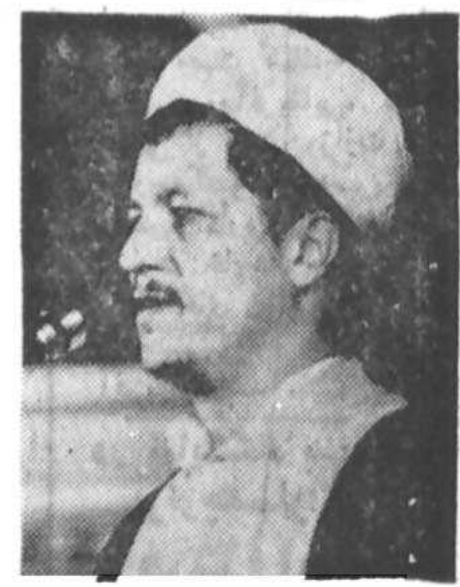
خون مطهری باعث شد که تمام آثارش رنگ خون و انقلاب گرفت در صفحه ۱۷

مطهری استوانه انقلاب بود مطهری حلال مشکلات فکری زمان بود