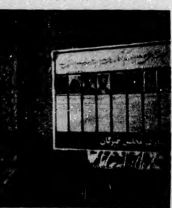
جنش مسلمانان مبارز مصاحبه مطبوعاتی

صبح روز پنجشنبه ۵۸/۵/۱۸ دعوت جنیش مسلمانان مبارز مصاحبه مطبوعاتی با شرکت خبرنگاران و ارباب‌جراید در محل دفتر هفته‌نامه امت تشکیل گردید. که در آن نقطه نظرهای جنیش مسلمانان مبارز، در مورد انتخابات و مجلس خبرگان، آزادیهای مطبوعات و مسائل وحدت از جانب سه نفر از اعضا و مسئولین جنیش بیان شد. مسئولین در مصاحبه با طرح مقدمه‌ای در ابتدا توضیحاتی دادند و در مورد انتخابات علاوه بر بررسی مواضع جنیش مسلمانان مبارز بی‌امون آن، چگونگی نقض آزادیها و اعمال نفوذهای را برشمردند، و همچنین انتظار خود را از مجلس خبرگان بیان داشتند. در این قسمت تشریح کنندگان مواضع جنیش مسلمانان مبارز اظهار داشتند که ما