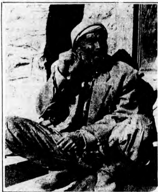
کارگر معدن: فرمانی استعمار و جنایات سرمایه داران وابسته به امپریالیسم آمریکا

۴ - استقلال اقتصادی کشور قطع هرگونه وابستگی تنها با قطع کردن دست سرمایه‌داران وابسته و نفی صنایع داخلی و تبدیل صنایع به صنایع مادر امکان‌پذیر است. ۵ - برای نفع هرگونه استعمار و حقوق حاکمیت کارگران بر سر بوسه خویش توانین صد کارگری لگو و فوایس جدید کار با شرکت فعال کارگران به نحوی تنظیم گردد که تدریس به دست سوراها و واقعی کارگران سپرده شود. ۶ - با انتداب محافظه‌کارانه مسئولین در جهت نیست سوراها و ظاهری و مصنوعی محکوم کرده و معتمدین که سوراها باید اساسی ترین نقش را در کارخانه‌ها داشته باشند. ۷ - مدیریت در کارخانه‌ها یک شخص نیست و این یکی از وظایف سوراها می‌باشد بر این اساس باید آشنایان سوراها به