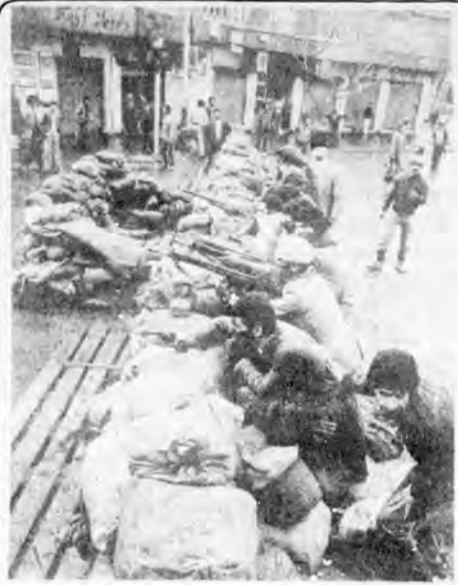
اگر پس از انقلاب هم همین تودههایی که آنروز در سنگرهای مبارزه، دلاورانه جنگیدند، حاکمیت می یافتند، امروز گرفتار چنین مشکلاتی نبودیم.

اگر گشکنش و انحراف و استکبار رهبران، برخی از مردم را گمراه، سرگردان، مأیوس، ناراضی و حتی مخالف انقلاب و رهبری کرده است، هنوز میلیونها مردم ستمکشیده و جان بر کف در شهر و روستا در سنگرهای نبرد، در کارخانه و مزرعه و زاغه ها و کوچه ها، به آزادی و عدالت و انقلاب اسلامی عشق می ورزند و برای جلوگیری از خشک شدن نهال لیزان و نازک انقلاب خون پاک خویش را هدیه میکنند.